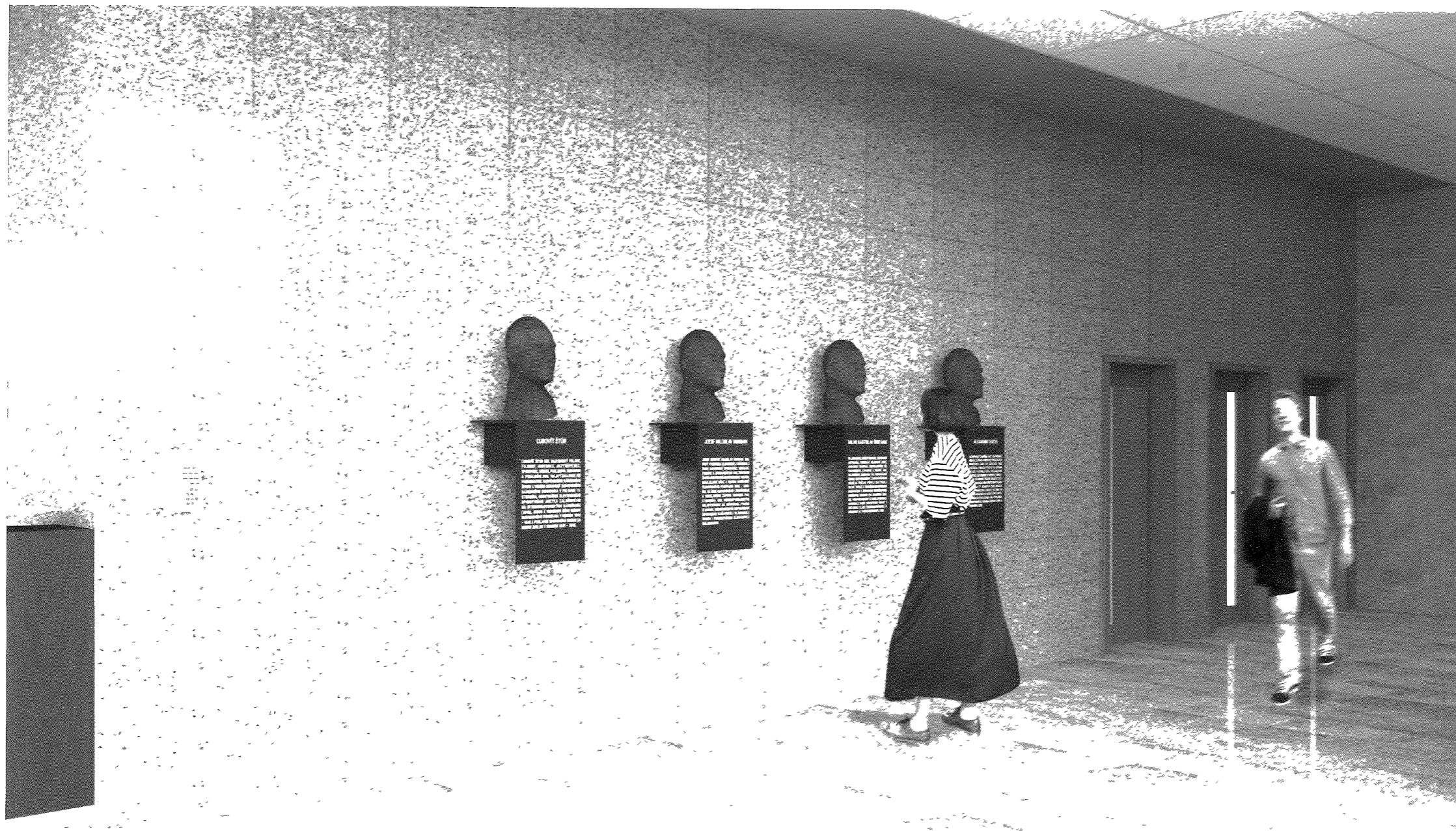
ARCHITEKTONICKO-SOCHÁRSKE RIEŠENIE INŠTALÁCIE BÚST HISTORICKY VÝZNAMNÝCH OSOBNOSTÍ TRENČIANSKEHO KRAJA VO VSTUPNEJ HALE TSK