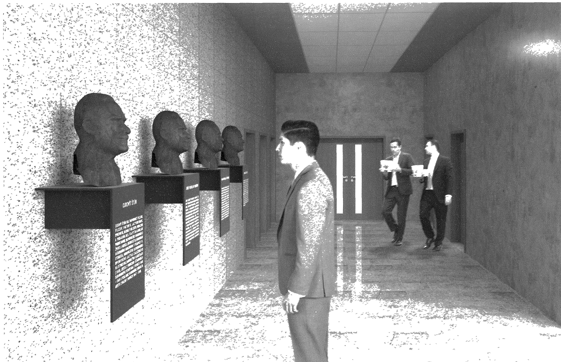
ARCHITEKTONICKO-SOCHÁRSKE RIEŠENIE INŠTALÁCIE BÚST HISTORICKY VÝZNAMNÝCH OSOBNOSTÍ TREŇCIANSKEHO KRAJA VO VSTUPNEJ HALE TSK